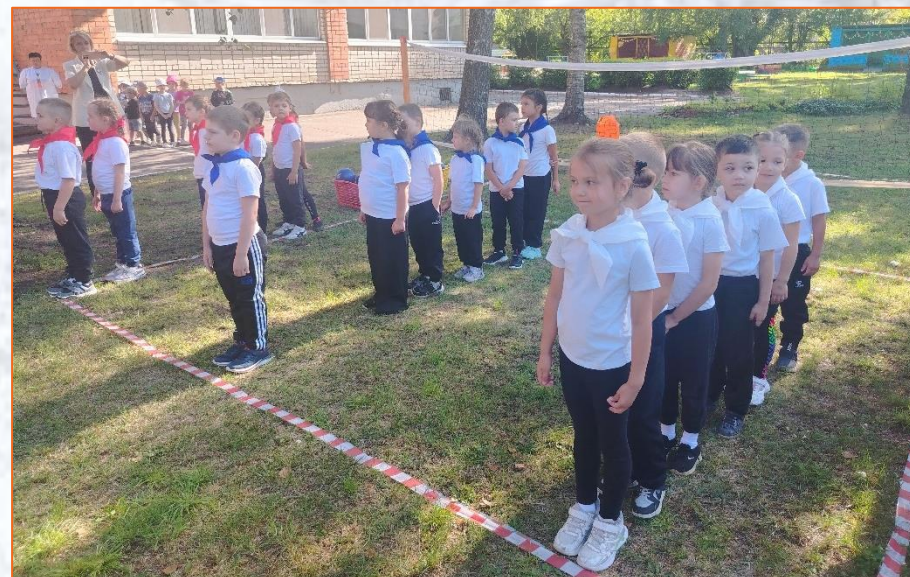
Подготовка к турниру