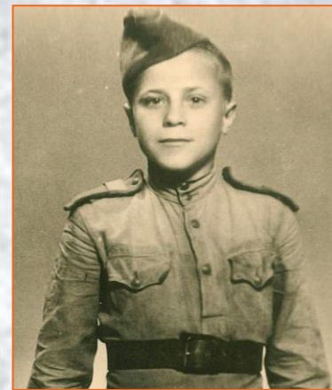
Ребята с увлечением слушали истории о детях-партизанах Брянщины