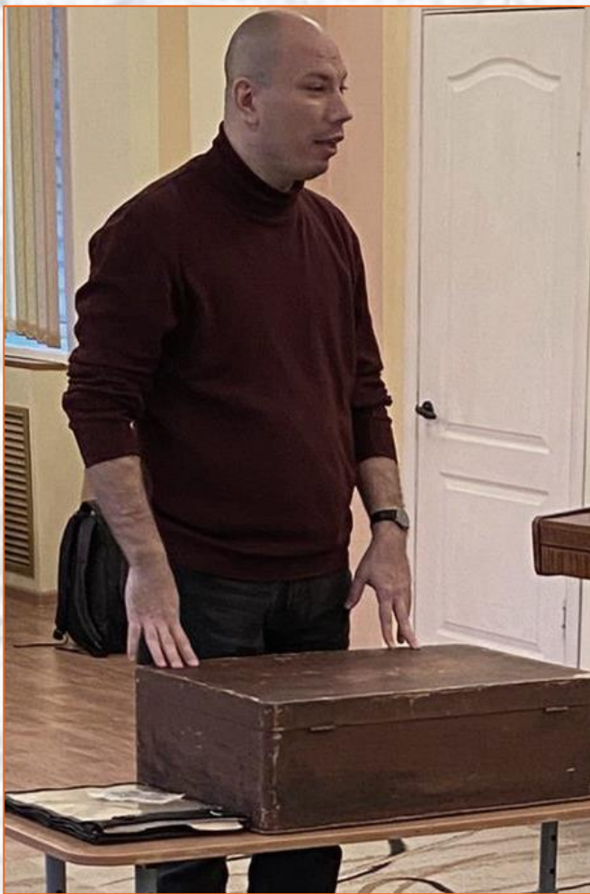
Встреча с работниками Мемориального комплекса «Партизанская Поляна»