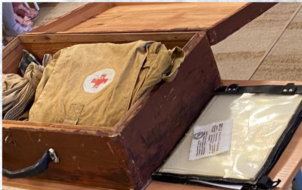
«Партизанская поляна» – музей в чемодане