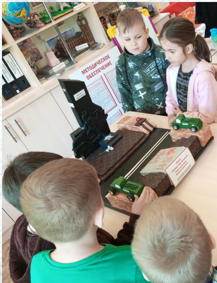
Памятные места Брянска, посвященные великой Победе