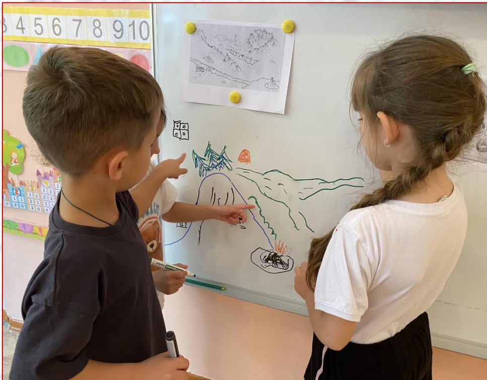
Схема воссоздаваемого объекта

Каждая подгруппа работает над своим объектом реконструкции