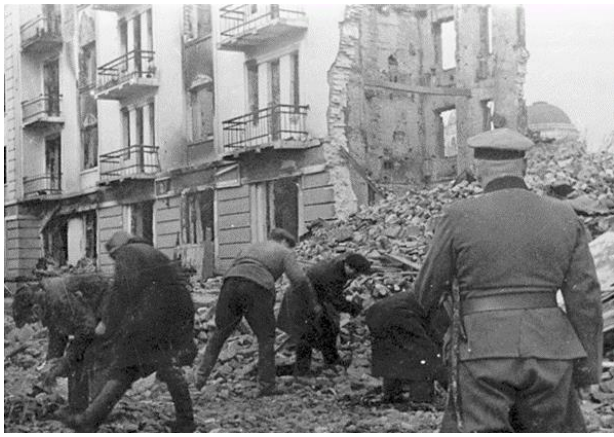
5. Население г. Калинина на принудительных работах по расчистке улиц. Октябрь 1941 г.