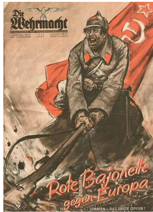
2. Нацистский антисоветский плакат времени Великой Отечественной войны 1937 г.