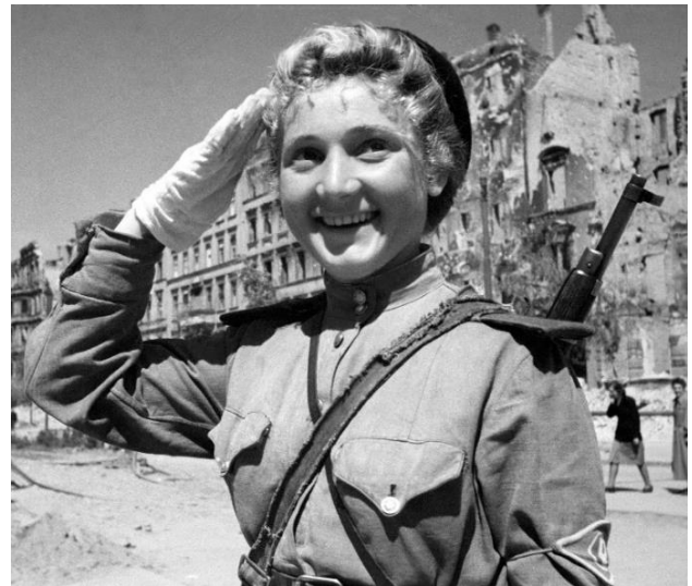
4. Советская регулировщица в Берлине 1945 г.