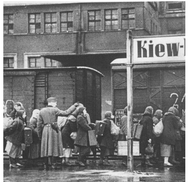
6. Отправка советских людей на принудительные работы в Германию 1942 г.