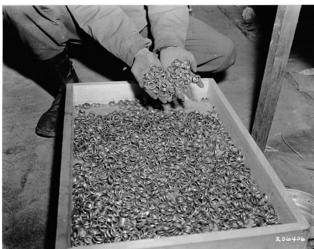
1. Золотые кольца жертв нацистских концентрационных лагерей 1945 г.