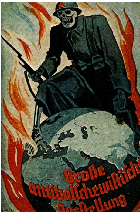
1. Призрак большевизма. Обложка буклета нацистской антибольшевистской выставки 1937 г.