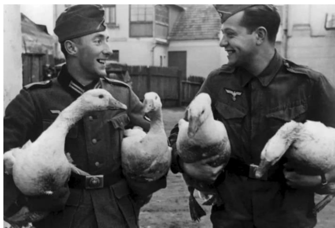
2. Солдаты нацистской Германии с гусями отобранными у мирного населения СССР