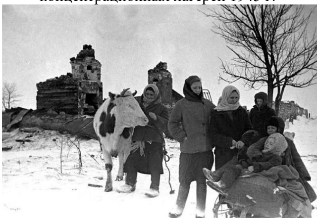
3. Сельские жители у своих разрушенных домов. 1941 г.