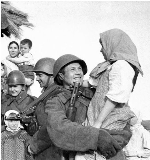
3. Западный фронт. Встреча населения освобождённой от фашистов деревни с бойцами Красной Армии 1943 г.