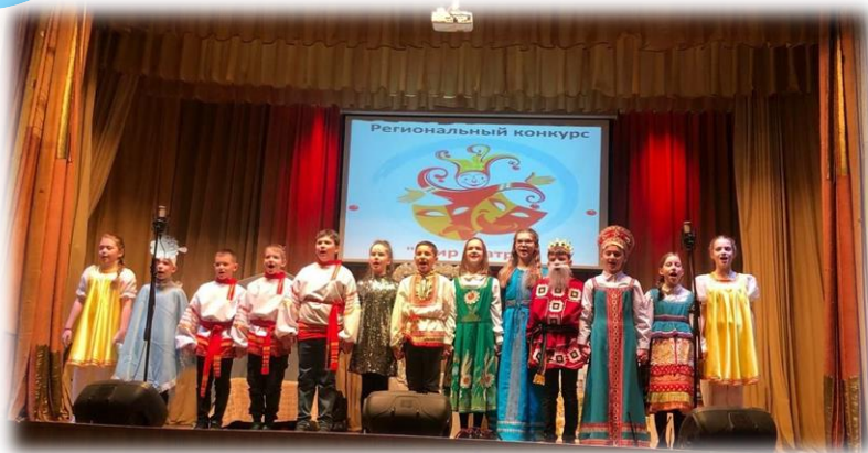
Театральная студия «Улыбка»