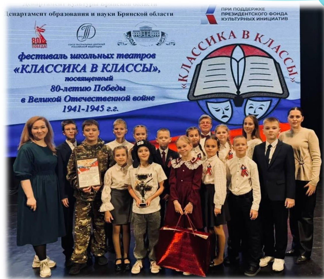
Театральная студия «Браво»