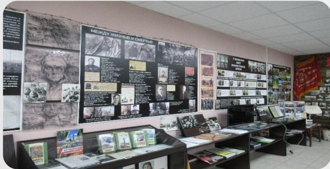
Музей БТЭМиРЭ г. Брянск