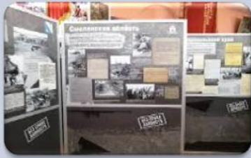
Передвижная музейная экспозиция