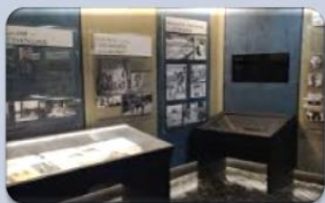
Тематическая музейная экспозиция