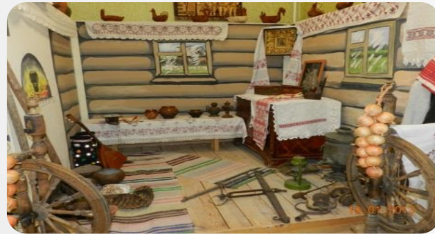
Музей школы № 6 г. Новозыбкова