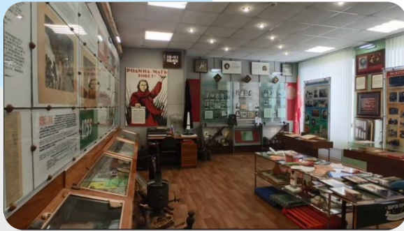
Музей Любохонской школы Дятьковского района