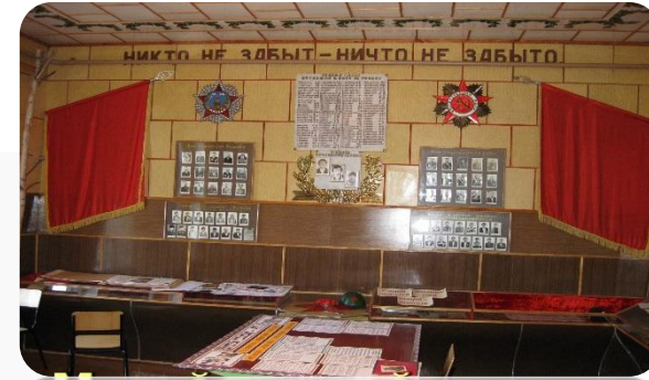
Музей Холмечской школы Суземского района