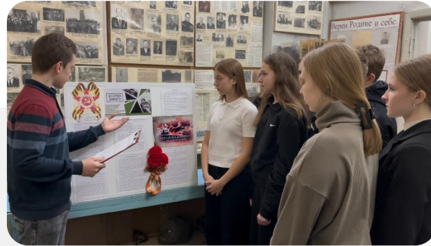
Бочаровская школа Комаричского района