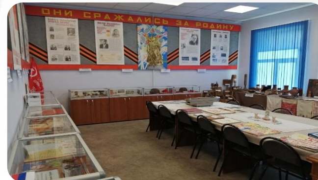
Музей Вышковской школы Злынковского района