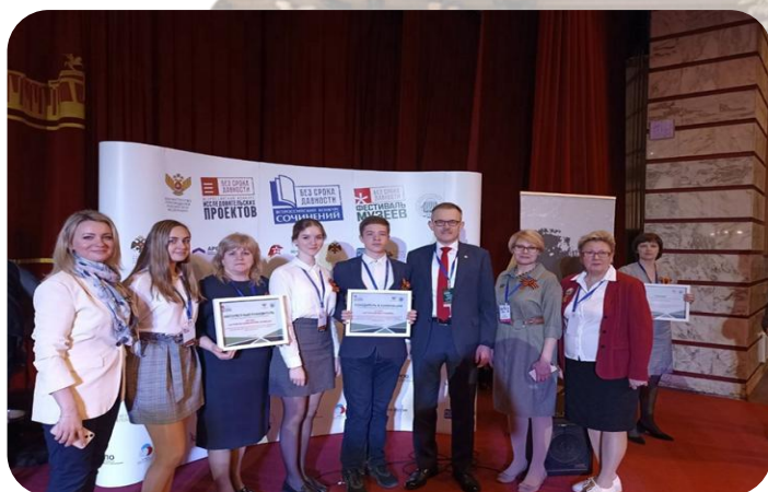
Делегация музеев Брянской области, 2022 г. (СОШ № 14 г. Брянска и БТЭМиРЭ)