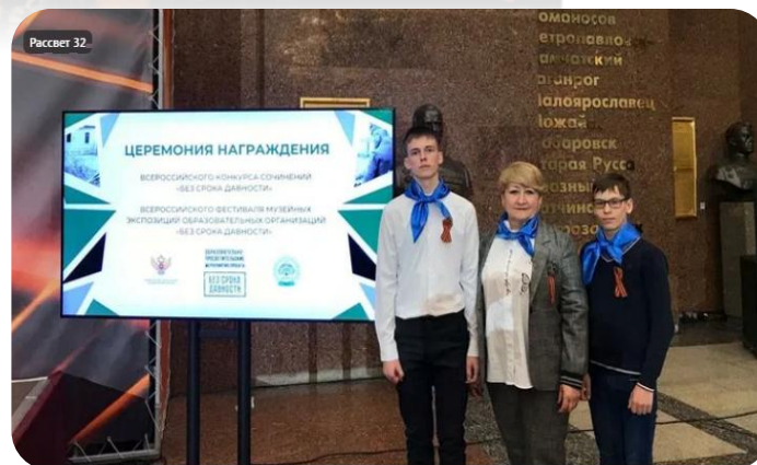
Делегация музея Холмеческой школы Суземского района, 2023 г.