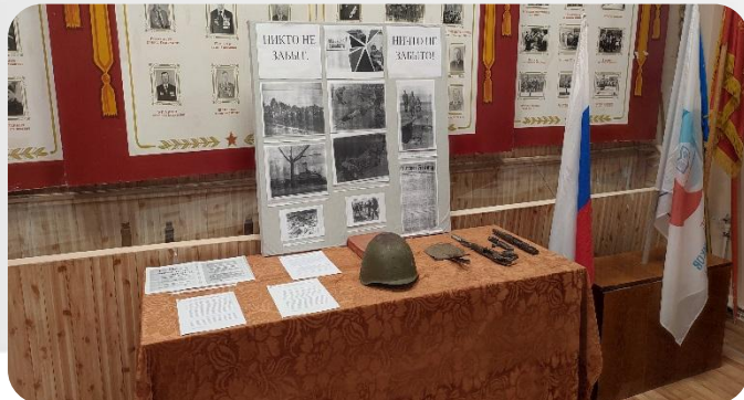
Музей школы № 6 Г. Клинцы