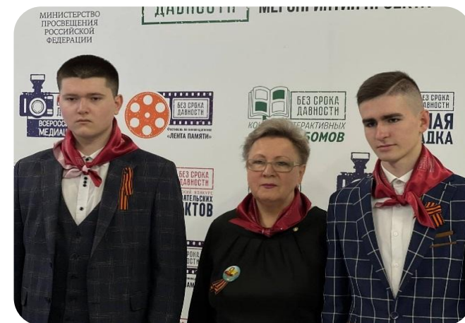
Делегация музея БТЭМиРЭ, 2024 г.