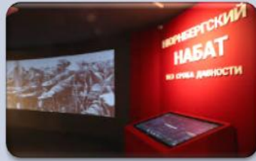
Виртуальная музейная экспозиция