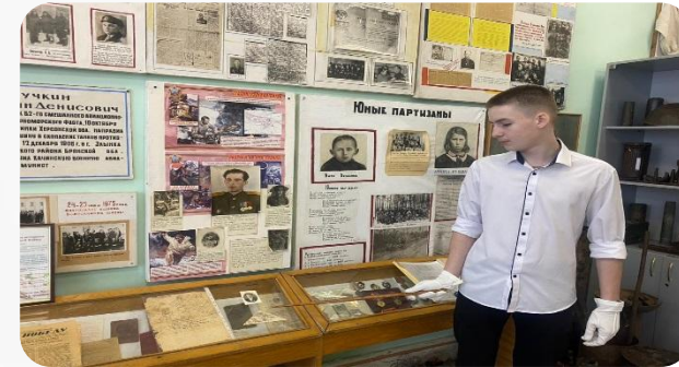
Музей Злынковской школы №1