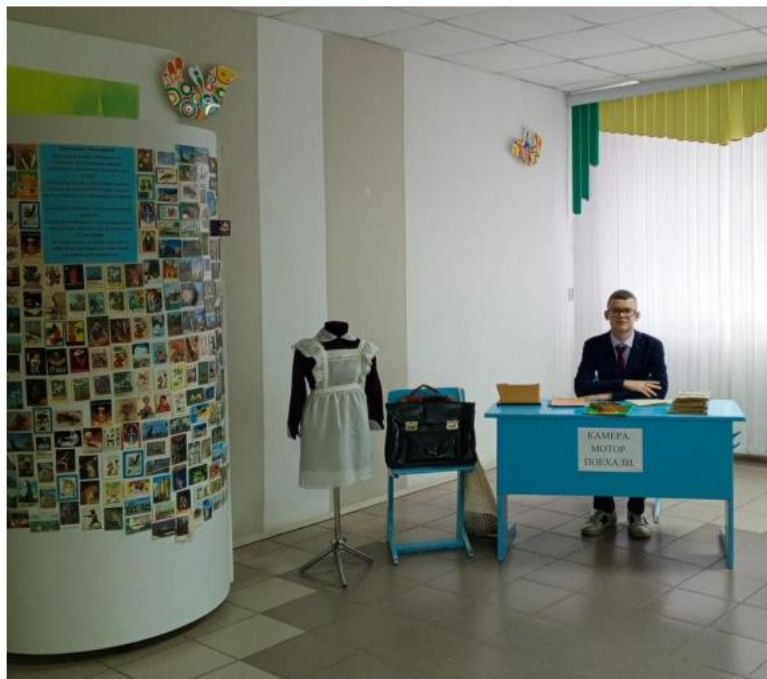
Фотозона «Советская школа».

Квест «Образ учителя в кинематографе». Один из этапов.