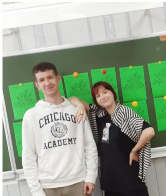
Сад открытого образования