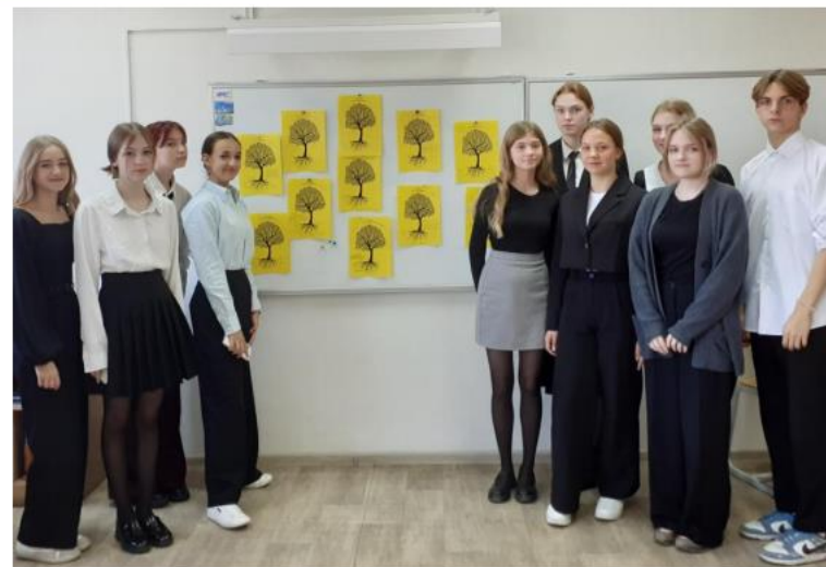
Корни образовательного успеха