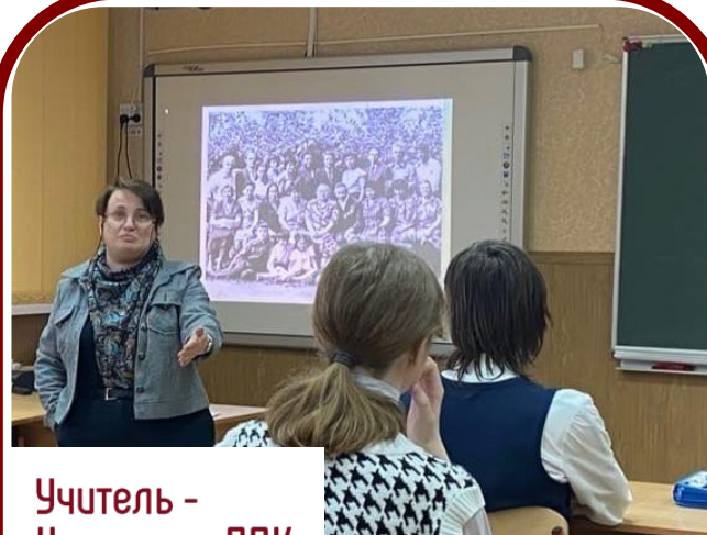
Учитель – Наставник ППК