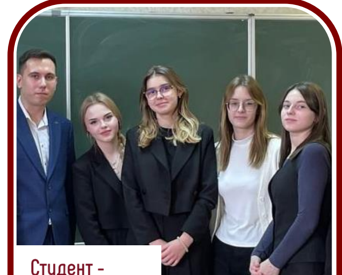
Студент – Наставник ППК