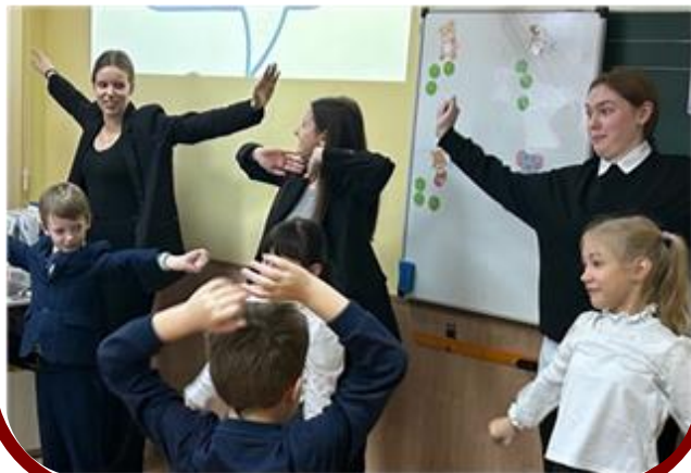
Старшеклассник – Наставник в дошкольном лагере