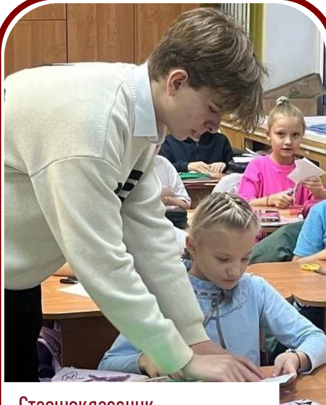
Старшеклассник – Наставник проекта «Орлёнок»