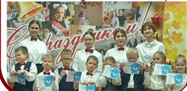
Старшеклассник – Наставник консультативного центра