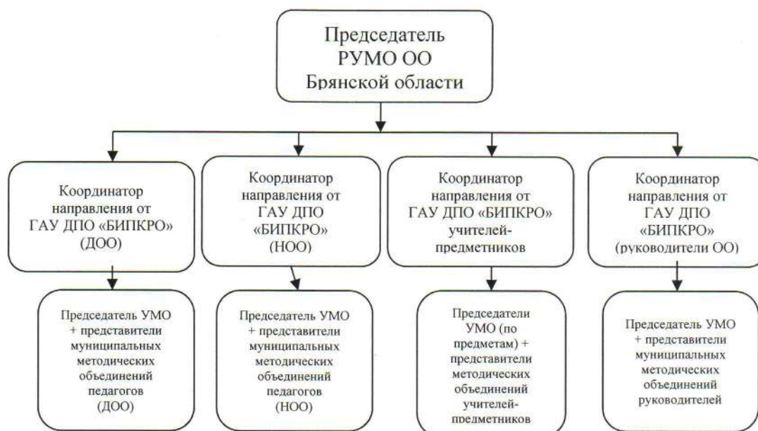
Рис. 2. Структура РУМО общего образования Брянской области

В состав регионального учебно-методического объединения входят руководители муниципальных методических объединений учителей-предметников.