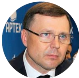
Константин Федоренко директор ФГБОУ МДЦ «Артек»