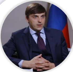
Сергей Кравцов Министр просвещения Российской Федерации