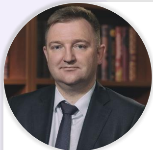
Александр Бугаев Первый заместитель министра просвещения Российской Федерации

О всероссийской молодёжной акции «Наши семейные книги памяти» (8 сентября, Москва)