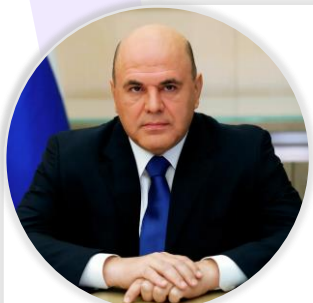
Михаил Мишустин Председатель Правительства Российской Федерации

«Дорогие учителя, дорогие наставники, от всей души хочу вас поздравить с этим замечательным праздником. Пожелать всего самого доброго. Чтобы у вас всё получилось, чтобы новые методики случились, чтобы дети вас слушались и чтобы работа ваша приносила удовольствие, воспитывала наше новое поколение в самых лучших традициях нашей страны»