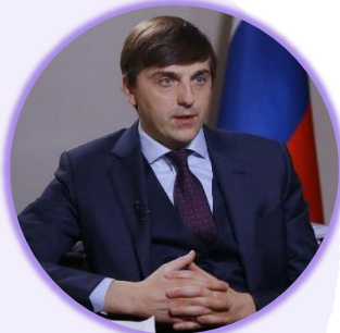
Сергей Кравцов Министр просвещения Российской Федерации

Комментируя установленный порядок формирования списка нормативных словарей, справочников и грамматик современного русского литературного языка ( Постановление Правительства Российской Федерации от 1 июля 2023 г. № 1092) (3 июля, Москва)