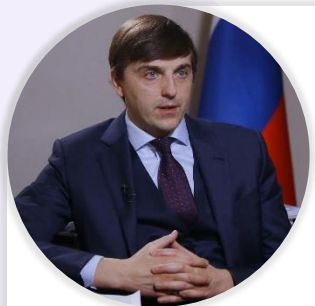
Сергей Кравцов Министр просвещения Российской Федерации