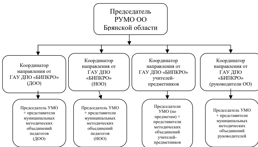
Рис. 2. Структура РУМО общего образования Брянской области

Работа в 2022 году велась по следующим направлениям: