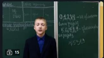
Урочная деятельность: Классика жанра

Видеоуроки для всех и каждого День назад