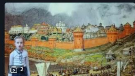
Ступеньки мастерства: Вперед, в будущее

Видеоуроки для всех и каждого День назад