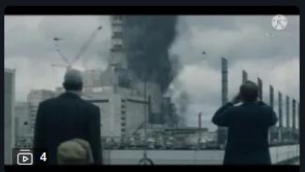
Внеурочная деятельность: Страницы памяти

Видеоуроки для всех и каждого 25 минут назад