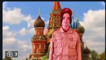
Внеурочная деятельность: мы вместе

Видеоуроки для всех и каждого 23 минуты назад