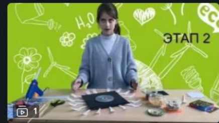
Внеурочная деятельность: Жить здорово

Видеоуроки для всех и каждого День назад