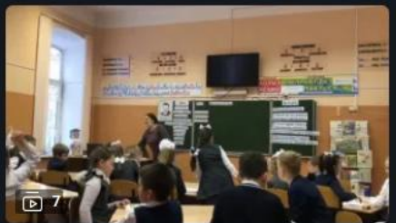
Ступеньки мастерства: Методическая копилка

Видеоуроки для всех и каждого День назад