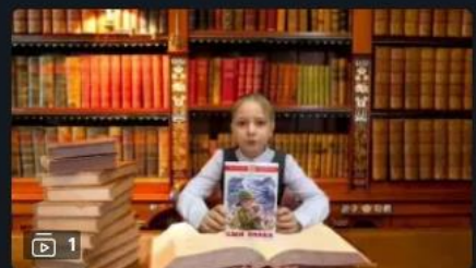
Внеурочная деятельность: Мудрые советы

Видеоуроки для всех и каждого 24 минуты назад