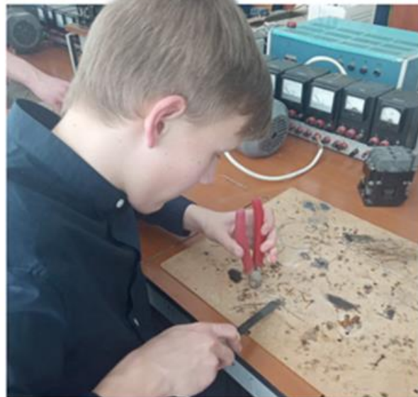
Работа начинается довольно рано: читать электрические схемы и

Какой помнят профориентацию в школе дедушки и бабушки, папы и мамы современных брянских школьников? Это был целый комплекс мероприятий, состоящий из уроков труда, экскурсий на производство. В старших классах подключались занятия в учебно-производственных комбинатах (УПК). И, завершая обучение, ребенок знал - пойдет ли он учиться в вуз или выберет профессию.