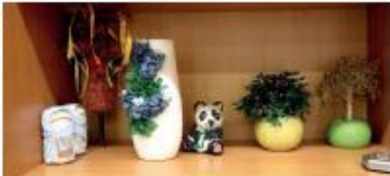
Богатство воображения и фантазии, фантазия и фантазия

Своими руками ребята изготавливают куклы. В этот период дети знакомятся с историей куклы, ее значением в культуре. Затем ребята приступают к изготовлению куклы. В процессе работы они знакомятся с традициями изготовления куклы в разных странах. В конце занятия ребята выполняют задания по изготовлению куклы.