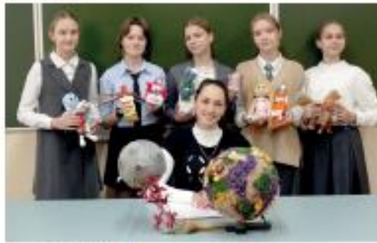
Замечательная работа учеников гимназии № 2 имени С.В. Шаховского города Брянска

Ребята, особенно девочки, приходят на занятия с интересом, а потому занятия проходят в форме игры. В начале занятия ребята выполняют задания по изготовлению куклы. В этот период дети знакомятся с историей куклы, ее значением в культуре. Затем ребята приступают к изготовлению куклы. В процессе работы они знакомятся с традициями изготовления куклы в разных странах. В конце занятия ребята выполняют задания по изготовлению куклы. В этот период дети знакомятся с историей куклы, ее значением в культуре. Затем ребята приступают к изготовлению куклы. В процессе работы они знакомятся с традициями изготовления куклы в разных странах. В конце занятия ребята выполняют задания по изготовлению куклы.