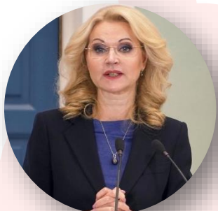
Татьяна Голикова Заместитель Председателя Правительства

«Задача предстоящего Года педагога и наставника — не только привлечь внимание к этой профессии и воздать должное уважение нашим учителям и наставникам, но и повысить интерес молодёжи к педагогике, привлечь в педагогические вузы творческих, способных, активных абитуриентов, которые после окончания вуза придут работать в школы»