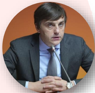
Сергей Кравцов Министр просвещения Российской Федерации

В ходе заседания Комитета по среднему профессиональному образованию, профессиональному обучению и профессиональной ориентации Российского союза промышленников и предпринимателей (РСПП) в Минпросвещения России (12 декабря, Москва):