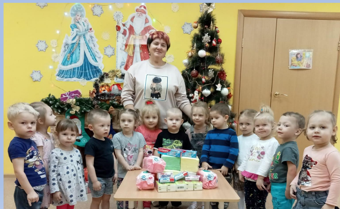
Акция «Добро без границ»