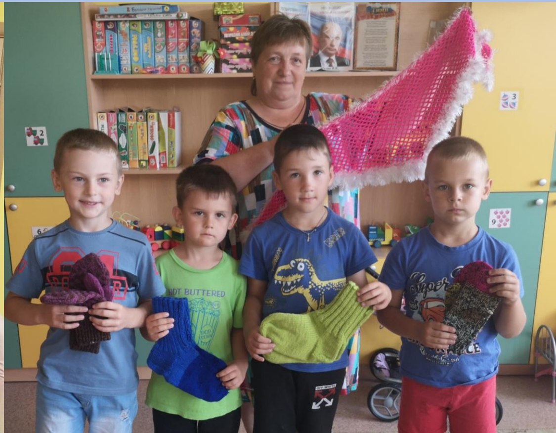
Акция «Бабушкина забота»