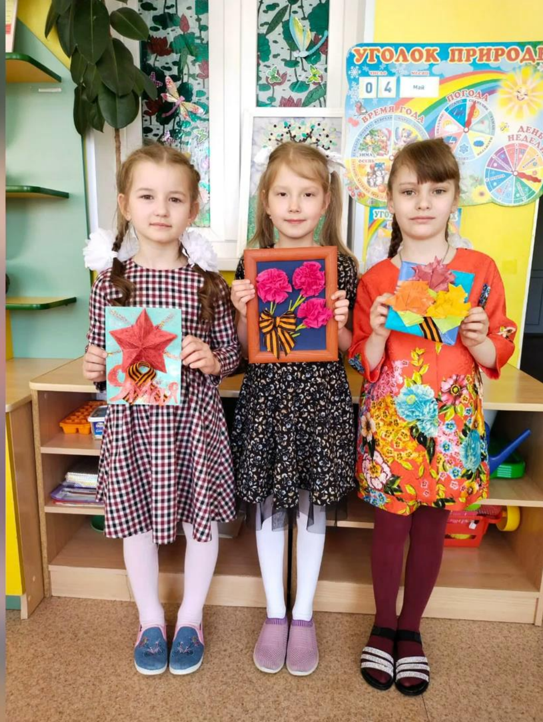
Патриотическая акция "Открытка ветерану" МБДОУ д/с "Сказки"