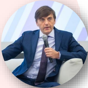
Сергей Кравцов Министр просвещения Российской Федерации

В ходе открытого разговора , предваряющего старт студенческой экспедиции «Школа мечты» в рамках межвузовского проекта «Открываем Россию заново» (Московская область, 17 октября):