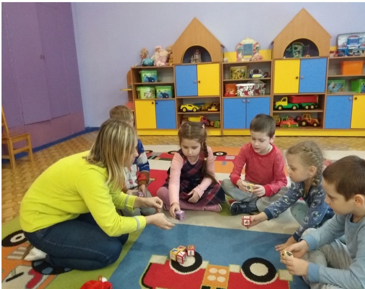
Сторителлинг по теме «День рождения». Авторская разработка