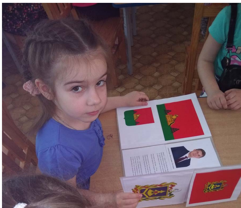
Работа с материалами лэпбука «Мой город Брянск». Авторское пособие