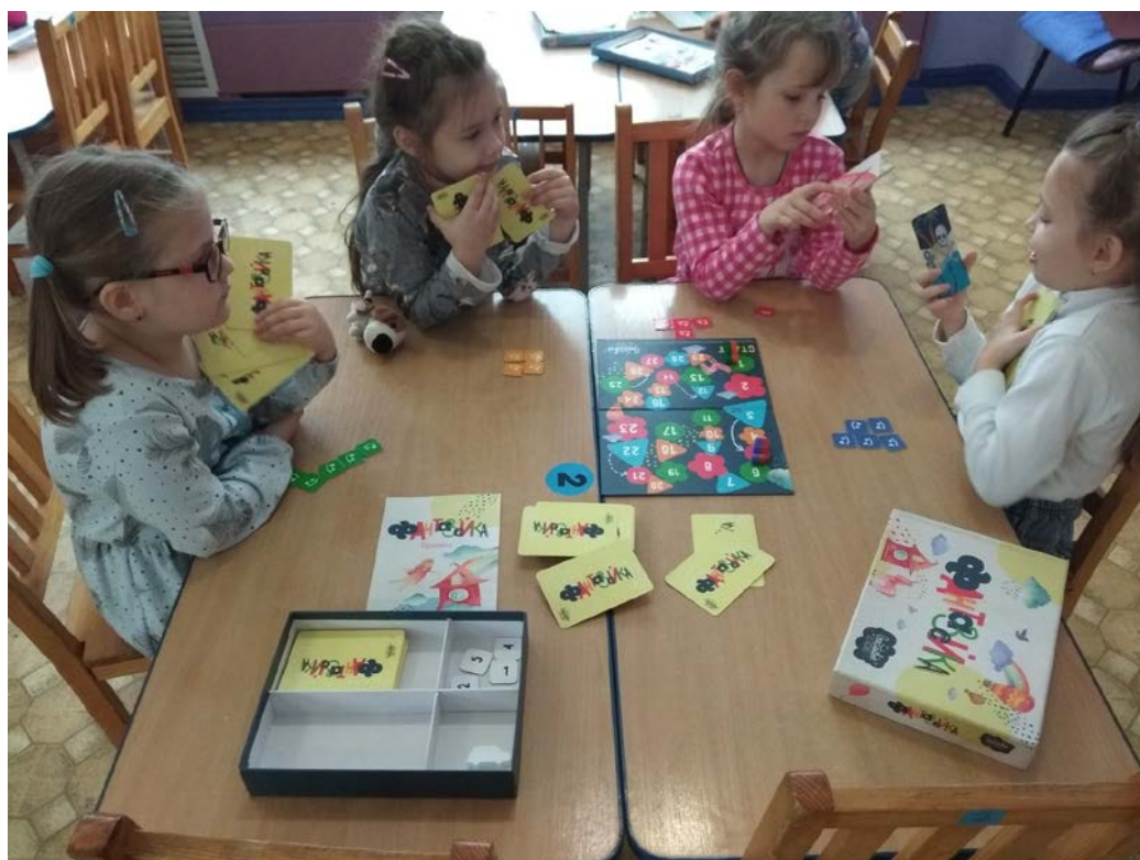
Настольно-печатная игра «Фантазейка»