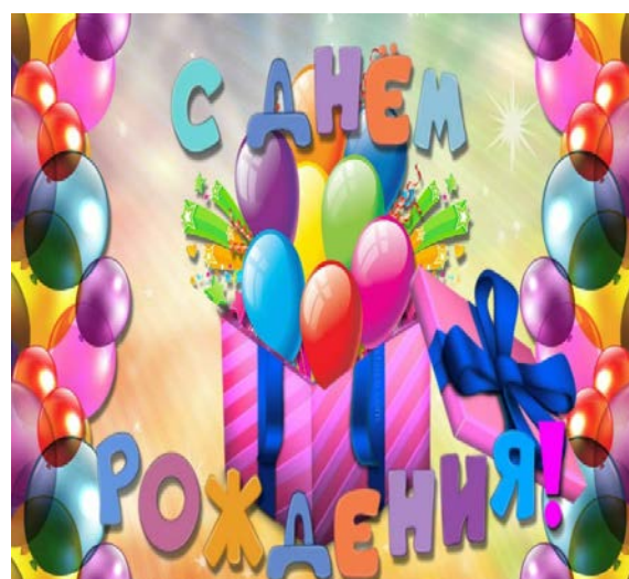
Картинки к сторителлингу по теме «День рождения»