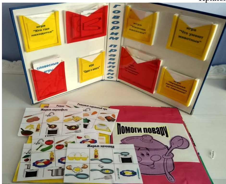
Лэпбуки «Говори правильно» и «Помоги повару»