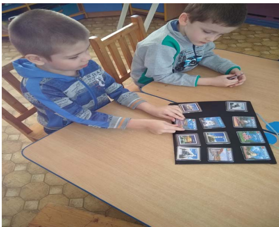
Магнитная доска «Я экскурсовод». Авторское пособие