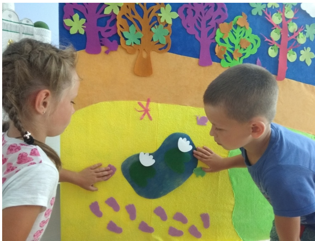
Путешествие по «Фиолетовому лесу»