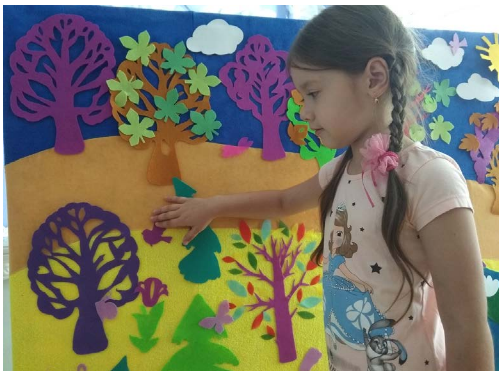
«Расскажи свою сказку»