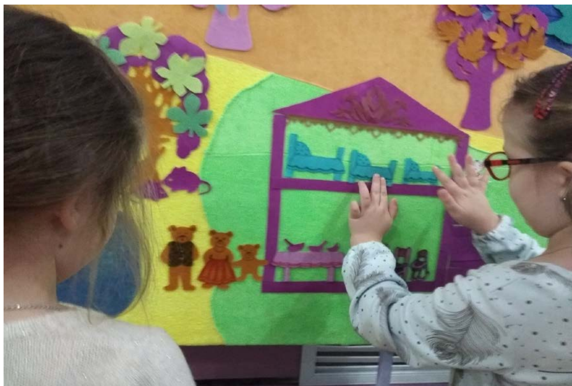
«Сказки на новый лад» - «Три медведя». Авторское пособие