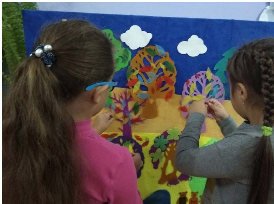
Развивающее панно «Фиолетового леса» Воскобовича