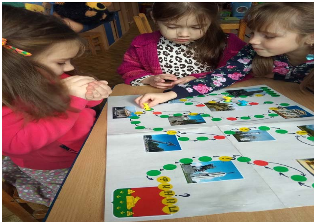
«Бродилка» - квест «Экскурсия по городу Брянску». Авторское пособие