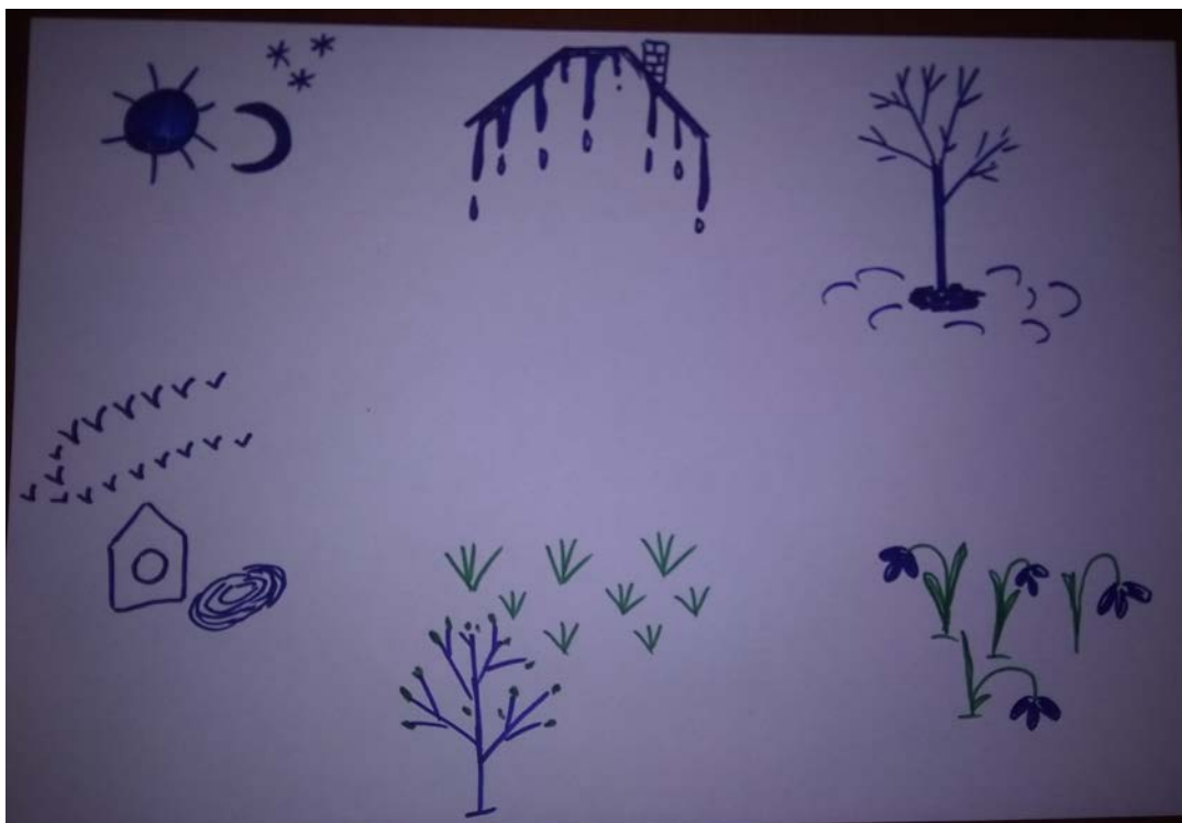
Мнемосхема по теме «Весна». Авторское пособие