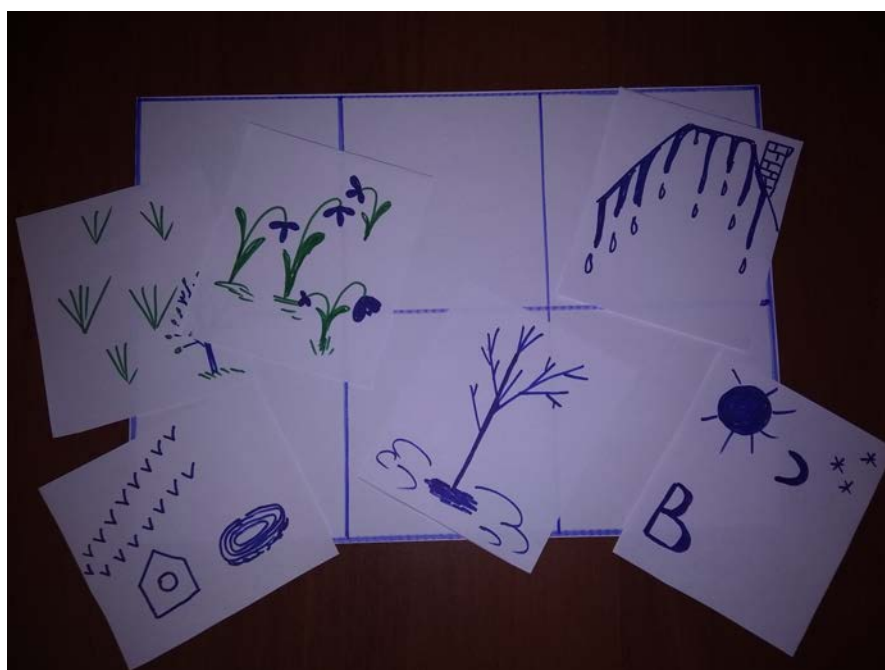
Мнемотаблица «Весна». Авторское пособие