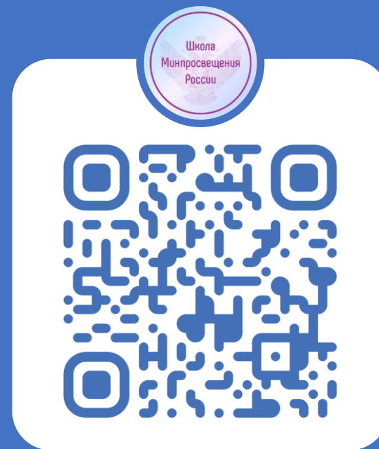
Школа Минпросвещения России