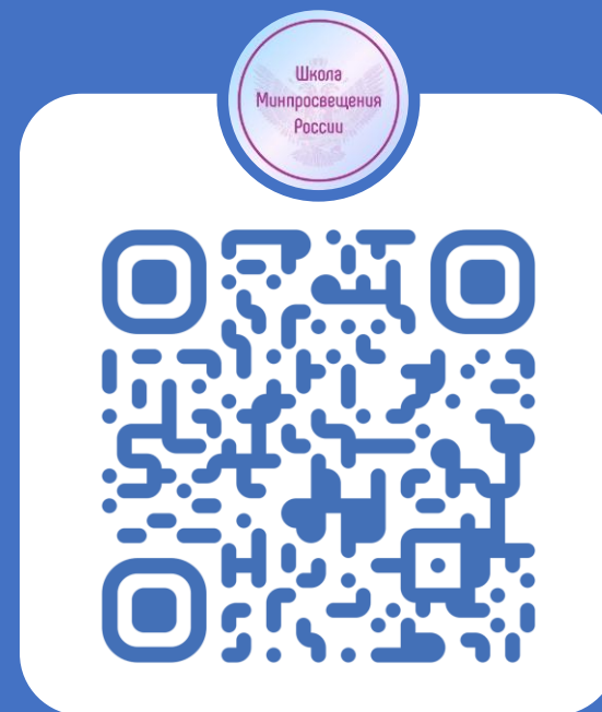
Школа Минпросвещения России