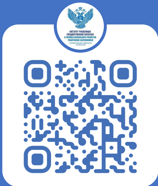
Институт реализации государственной политики